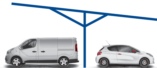
OMBRIÈRE PIED CENTRAL